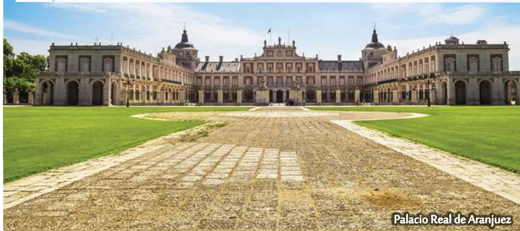
Palacio Real de Aranjuez