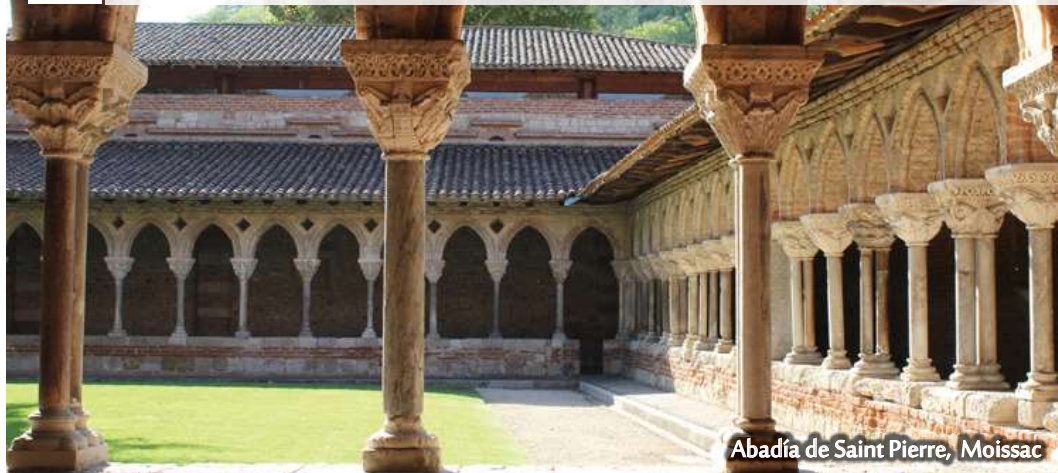
Abadía de Saint Pierre, Moissac